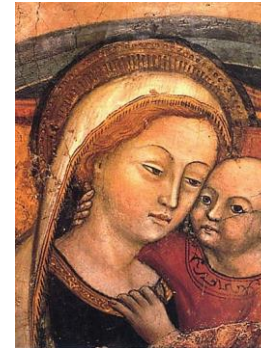
Ikone der Mutter vom Guten Rat in Genazzano

Die Verehrung Mariens als Mutter vom guten Rat wurde insbesondere von den Augustiner-Eremiten gefördert und verbreitet. Ein bekannter marianischer Wallfahrtsort, der diesem Patrozinium unterstellt ist und seit 1356 von den Augustiner-Eremiten betreut wird, ist das Heiligtum Unserer Lieben Frau vom Guten Rat in der italienischen Ortschaft Genazzano im Latium. Die Wallfahrten zu dem mittelalterlichen Gnadenbild dort sind seit 1467 gut dokumentiert. Etliche Päpste suchten den Wallfahrtsort auf und unterstützten die Wallfahrt dorthin: Urban VIII. am 21. Oktober 1630, Pius IX. am 15. August 1864, Johannes XXIII. am 25. August 1959 und Johannes Paul II. am 23. April 1993. Ein großer Förderer des Heiligtums war Papst Leo XIII., der die Kirche im Jahr 1902 ausschmücken ließ, am 23. April 1903 besuchte und die Kirche mit dem Breve Sacris Aedibus zur Basilika minor erhob.