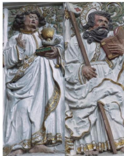
Jakobus und Johannes

Kath. Gemeinde St. Johann Holten Mechthildisstr. 3 46147 Oberhausen Telefon 0208/68 09 55 Fax 0208/621 54 56 e-mail: St.Johann.Oberhausen-Holten@bistum-essen.de Homepage: www.pfarrei-stclemens.de